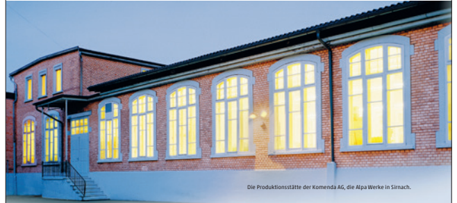
Die Produktionsstätte der Komenda AG, die Alpa Werke in Sirmach.