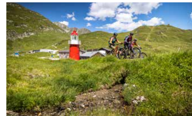
Am Leuchtturm auf dem Oberalppass beginnt die Reise durch die RheinWelten: 430 km dem Rhein entlang bis nach Basel auf der Rhein-Route Nr. 2.

Ein Stück weiter talwärts öffnet sich mit dem Benediktiner-Kloster Disentis ein kultureller Gegenpol zur sportlichen Aktivität. Als historischer Bezugspunkt des Tals verbindet es Spiritualität, Bildung, regionale Verwurzelung sowie Gastfreundschaft. Die Barockanlage bietet Raum zum Innehalten und erzählt von einer jahrhundertealten Tradition.