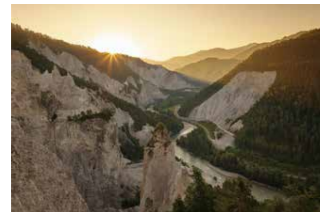
In der Rheinschlucht zeigt sich der Rhein von seiner spektakulärsten Seite.

Gold & Caramel verbindet Ursprung, Kultur und Kulinarik und steht für die Einzigartigkeiten der Region – vom Goldwaschen im jungen Rhein bis zur Füllung der Nusstorte. Dieser erste Abschnitt macht neugierig auf die weitere Reise.