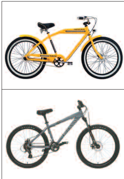
Nostalgischer Tiefstapler: Cruiser (oben). Hart im Nehmen: Kona dirt bike (unten).

Von der Carbon-Euphorie wurden die Alltags- und Trekkingvelos bislang nur gestreift. Hier halten sich zwei Grundtypen nebeneinander: mit Federgabel und gefederter Sattelstütze ausgerüstete Komfortmodelle und die auf Leichtgewicht getrimmten Flitzer, die mit Starrgabeln ausgerüstet sind. Die vollgefederten Modelle, welche vor ein paar Jahren noch überall im Mittelpunkt standen, werden nur noch von kleinen spezialisierten Firmen angeboten. Als eigener