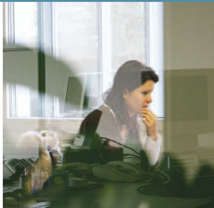
Helle, transparente Büros bei Intercycle.

Während das Massengeschäft mit Velos um 1500 Franken gemacht wird, pflegt das Unternehmen aus Marketinggründen auch die High-end-Kunden und sponsort Renn- und DownhillbikerInnen: Urs Freuler oder Beat Breu machten Whee-